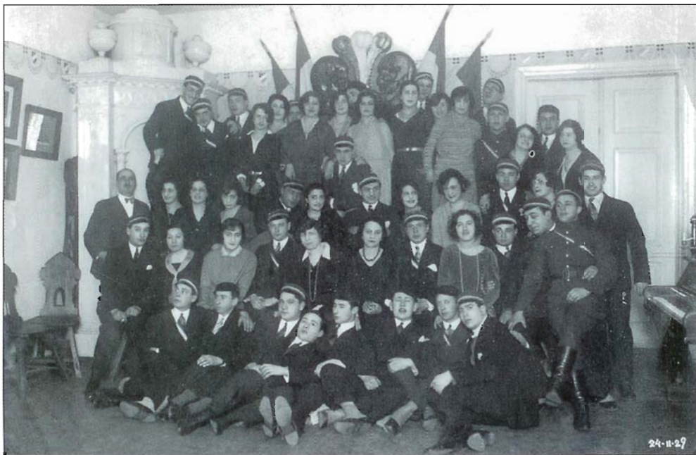
Korporatsioon "Limuvia" tudengid. Students from the Limuvia corporation. Корпорация "Лимувия"