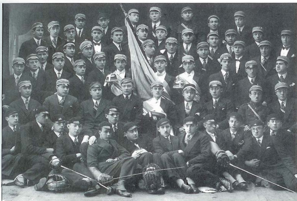
Korporatsioon "Hašmonea" tudengid. Students from the Hashmonea corporation. Студенты корпорации "Хашмонея".