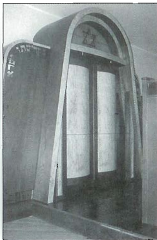
Uus sünaog. The new synagogue. Новая синагога.

Выступление ансамбля песни и танца Таллиннской еврейской школы на поминальной церемонии Дня памяти жертв Холокоста Йом хаШоа весной 2000 года