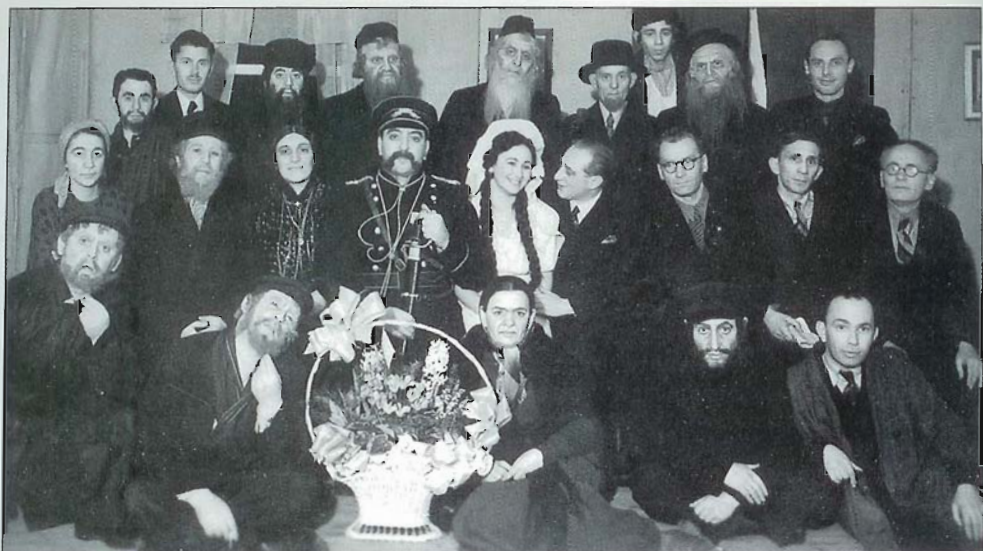
Juudi näitlejad pärast purimi-pühade etendust. Jewish actors after a Purim performance. Еврейские актёры после представления на празднике Пурим.