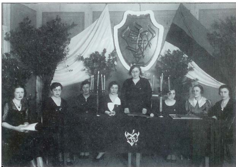
Üliõpilasseltsi "Hazfiro" kuulused tudengineiud. The female students from the Hazfiro student society. В студентческом обществе "Хацфи́ро" состояли девушки-студентки.