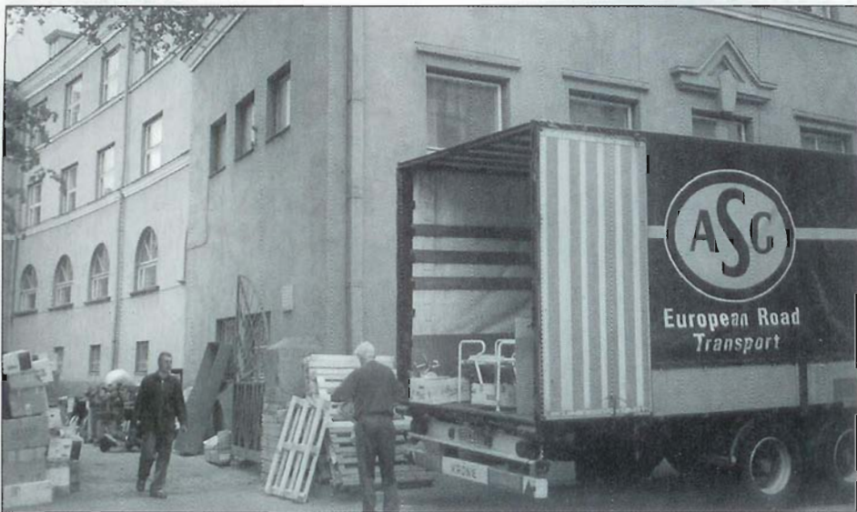
Rootsis tegutseva Balti Juudi Foorumi ( Baltic Jewish Forum ) lähetatud humanitaarabi mahalaadimine 1999. aasta suvel. Receiving humanitarian aid from the Baltic Jewish Forum (Sweden) in summer 1999.

Давид Бен-Гурион в Таллинне в 1933 году вместе с учениками Таллиннской еврейской гимназии из сионистской организации "Хашомер Хазиар"