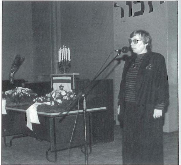
Eesti juutide holokausti meenutamine 15. detsembril 1991 Tallinna Juudi Kooli aulas. Memorising the Holocaust of Estonian Jews in the assembly hall of the Tallinn Jewish School on December 15, 1991. Поминовение эстонских евреев, погибших в годы Второй мировой войны. Зал Таллиннской еврейской школы 15 декабря 1991 года.