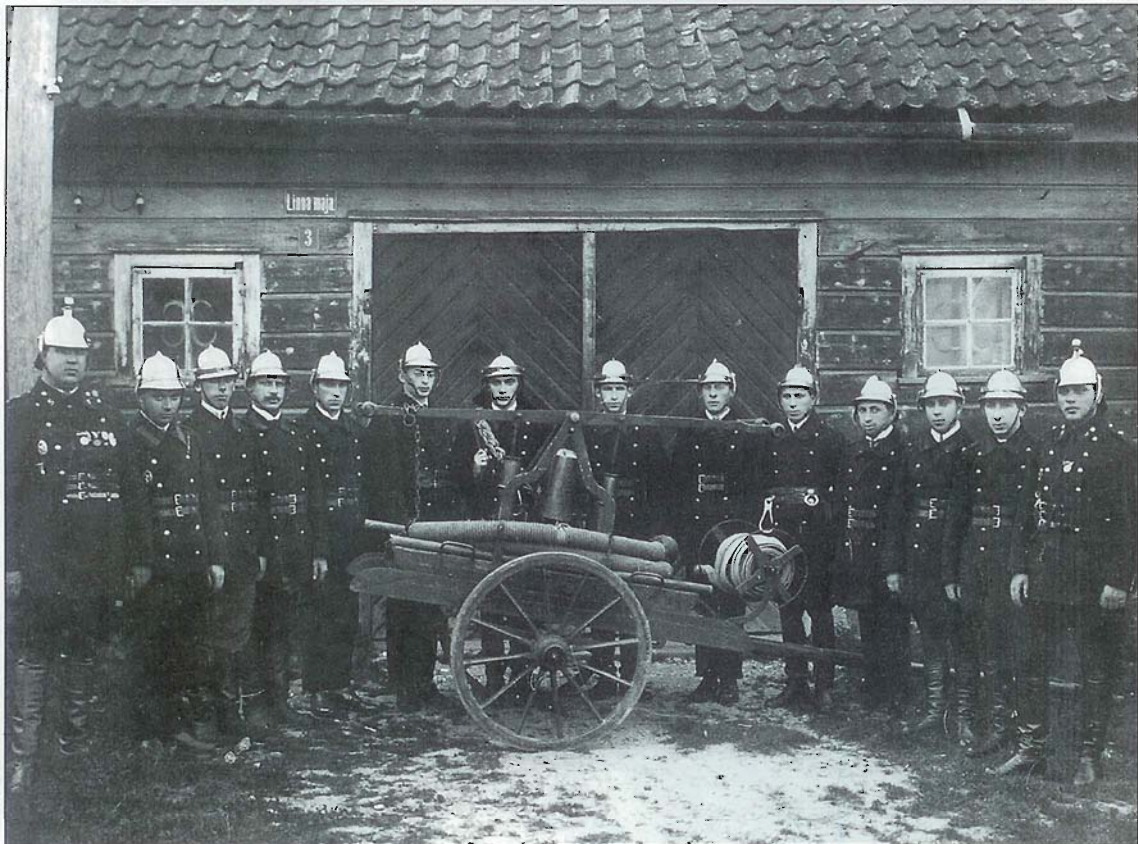
Tallinna juudi tuletõrjekomando. The Tallinn Jewish fire brigade. Таллиннская еврейская пожарная команда.