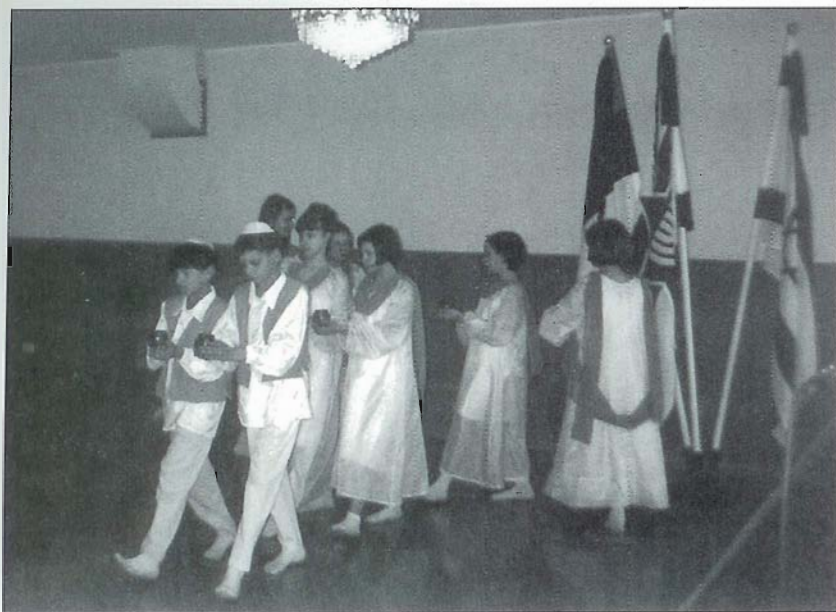
Tallinna Juudi Kooli tantsu- ja lauluansambli esinemine jom ha-shoa (holokaustipäeva) mälestustseremoonial 2000. aasta kevadel.

The song-and-dance group of the Tallinn Jewish School performing at a memorial ceremony of Yom ha-Shoa (the Holocaust Day), Spring 2000.