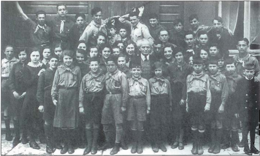
David Ben Gurion 1933. aastal Tallinnas koos Tallinna Juudi Gümnaasiumi õpilastega sionistlikust organisatsioonist "Hašomer Hazair".

David Ben-Gurion with pupils from the zionist youth organisation "Hashomer Hazair" in Tallinn in 1933.