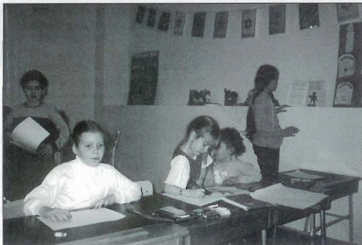
Tallinna Juudi Kooli õpilased 2000. aasta novembris.

Pupils of the Tallinn Jewish School in November 2000.