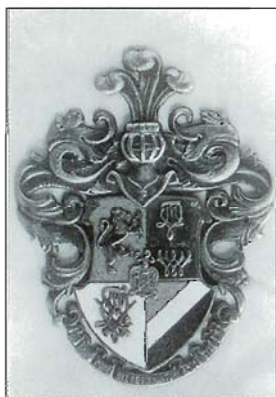
Korporatsioon "Limuvia" vapp. Coat-of-arms of the Limuvia corporation. Герб корпорации "Лимувия"