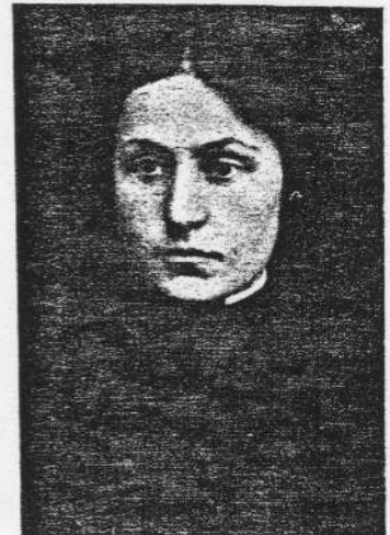
שיינע גארדין. אין די הויפט ראלן: „די שחיטה“ „געבראכענע הערצער“ „ראם אייביקע ליד“ „געברידער לוריע“ א. א.