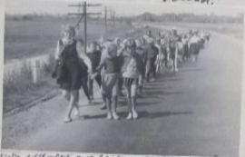
Сейчас мы уже стоим в м. Вайварскан. Здесь в первом лагере Вайварскан!

совершая поход в Вайварскан еврейский концлагерь, чтобы почтить память о замученных и уничтожен- ных узниках фашизма, возложить на их безымянные могилы первые полевые цветы.