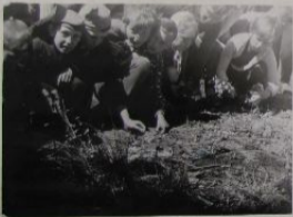
Ребята собирают грибы на лесной опушке. Снимается автором