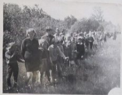
Приехав на окраину Сибирского концлагеря Вайварскан еврейские женщины