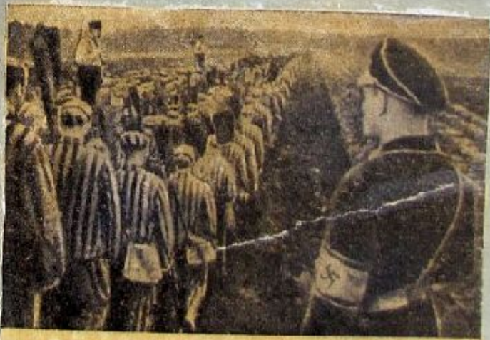
Тысячи людей, облаченных в полосатые рубы, шли в гетто-лагерь в Дахау Шли, чтобы никогда не вернуться. «Шиндель», Голбург.