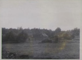
на фотографии: слева хутор Ойе Эмзабан, а справа (виден частично) - хутор Арбузия. Эти хутора находились в 800м от концлагеря, созданного в 1942 году.